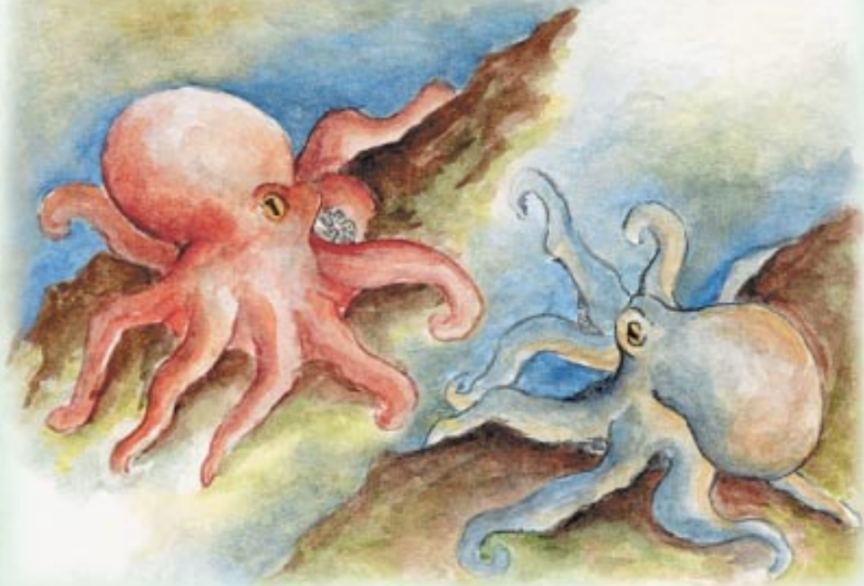
Polbo macho cortexando a súa femia.