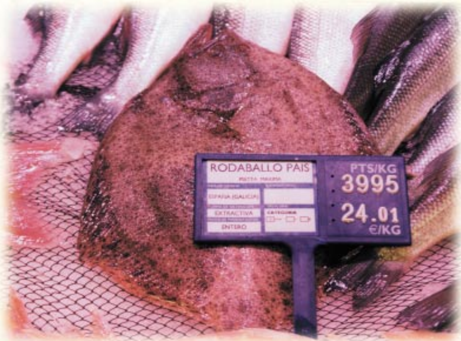
Rodaballo procedente de pesca extractiva.