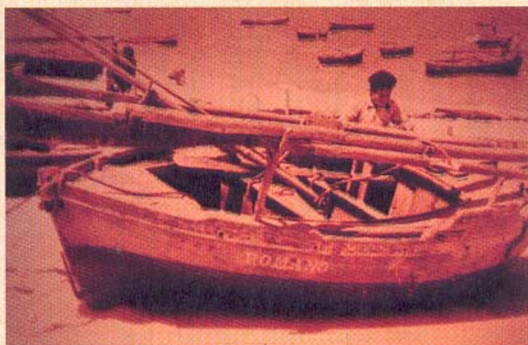
Bote Polbeiro de Bueu

ACTIVIDADES: Na actualidade completamente desaparecido, dedicábase principalmente á pesca do polbo, de alí o seu nome. Actividade que na ría de Pontevedra tivo unha grande importancia económica existindo documentos que datan de 1.563, 1.564, 1.568 e 1.750, nos que se regulan os meses de veda así como os aparellos de pesca permitidos.