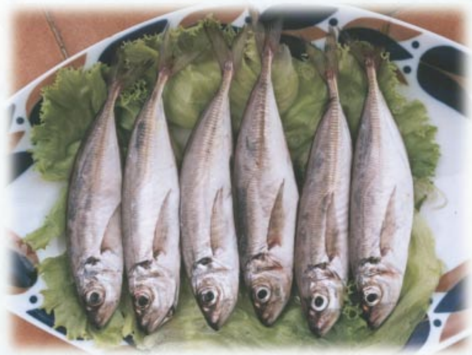
Prato de xurelos listos para fritir.